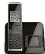
Telekom Sinus A 205

Sichern Sie sich für jedes bezahlte Neuabo mit einer Mindestlaufzeit bis zum 31. Dezember des Folgejahres eine der Prämien Ihrer Wahl!