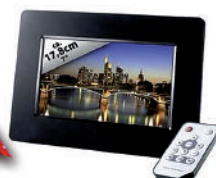
Intenso Digitaler Bilderrahmen